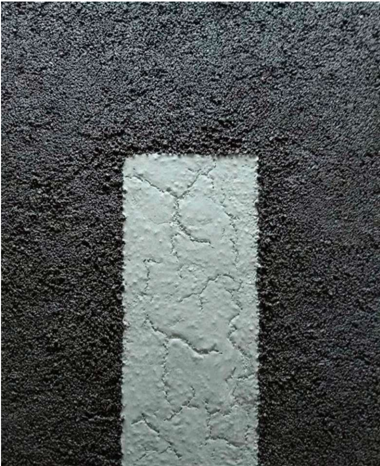
'Sunshine 2504', minerales y acrílico sobre tabla